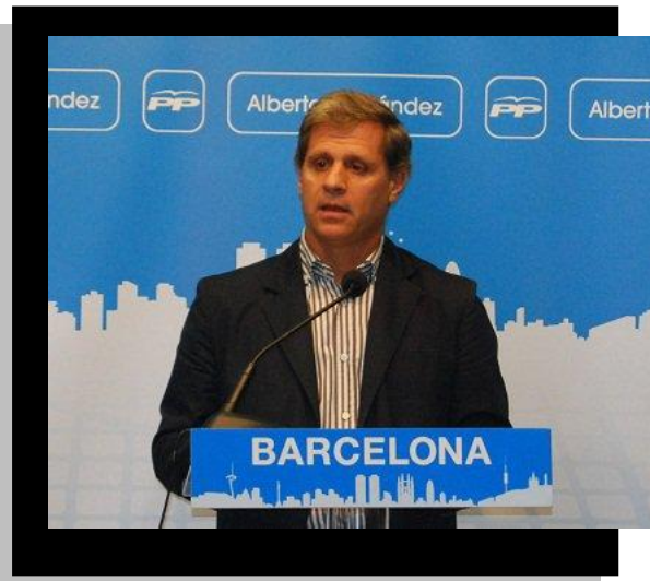
Alberto Fernández Díaz Candidato a la Alcaldía de Barcelona